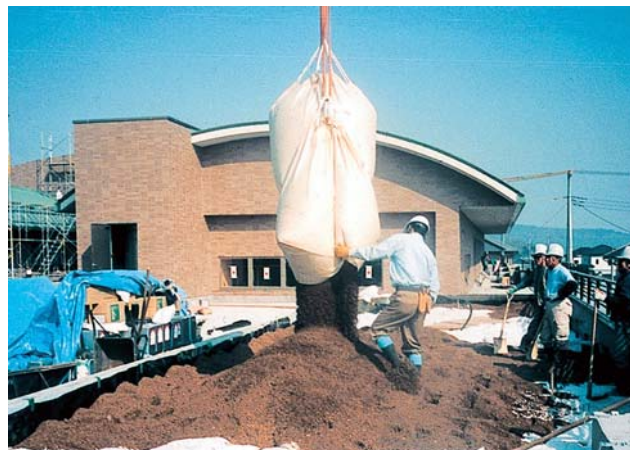
ホワイトローム4F充填、透水フィルター設置後、軽量人工土壌ピバソイル敷均し