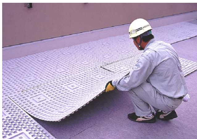
耐根補助シート・保護マット敷設後、αウェーブを設置