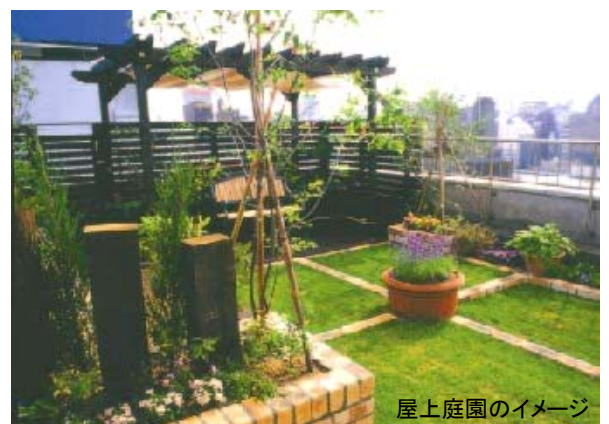
屋上庭園のイメージ