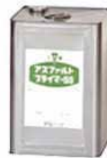
【アスファルトプライマーSS】