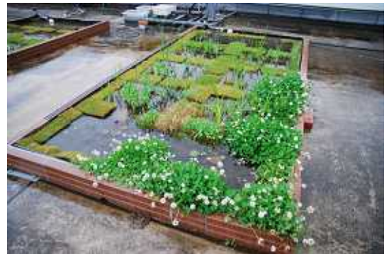
東京都市大学メディアセンター屋上での実験風景