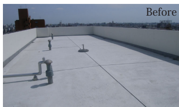
新築時に検討した屋上庭園は施工費が合わずコンクリートの広場になっていました。

住人さんが自由に使える憩いの場として屋上に80㎡もの緑地を備えた庭園が広がります。オーナーが屋上で育てた野菜を住人さんにお裾分けをしたり、住人さん主催のパーティが行われたり、屋上を通じて住人さんとオーナーの繋がりがより強くなっています。賃貸マンション激戦区にありながら満床稼働の秘訣はこの繋がりでないでしょうか。