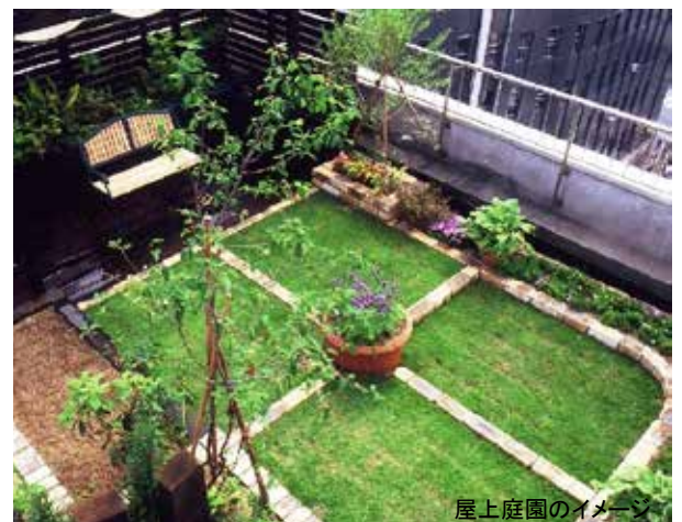
屋上庭園のイメージ